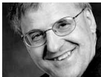
Louis- Dominique Lavigne

Louis-Dominique Lavigne est un auteur dramatique prolifique. Il a écrit, seul ou avec d'autres, plus d'une trentaine de pièces de théâtre, destinées aussi bien à la petite enfance et aux adolescents qu'au public adulte. Scénariste, metteur en scène, animateur et comédien, il a participé à de nombreuses créations collectives et collaboré à plusieurs séries télévisées pour l'enfance et la jeunesse. Sa pièce Les petits orteils , qui a été sélectionnée par l'Académie québécoise du théâtre comme finaliste dans la catégorie production jeune public de l'année 1998, obtient en 1992 le prix littéraire du gouverneur général du Canada.